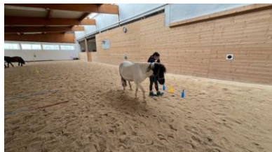
Pony durch einen Parcours führen