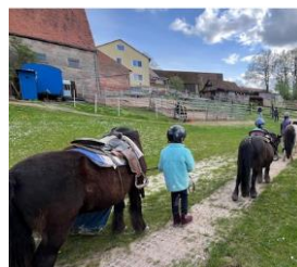
kurze Übungen am Pony

Haben wir Ihr Interesse geweckt? Dann sprechen Sie uns gerne an unter: +49 1577 9348956 (Mail: postmaster@rv-kunterbunt.de )