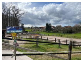
am Hof mitwirken