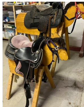
Übungen am Holzpferd