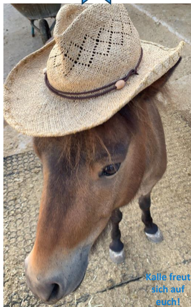
Kalle freut sich auf euch!